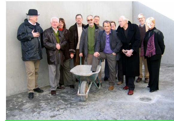
De jury van de 16 de Euro-kartoenale