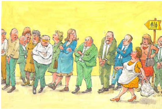
2 de prijs: Luc Vernimmen

Niet minder dan 989 tekenaars uit 84 landen zonden ons bijna 4000 cartoons. Zonder schroom kunnen we stellen dat de "Euro-kartoenale" hiermee tot de wereldtop behoort.